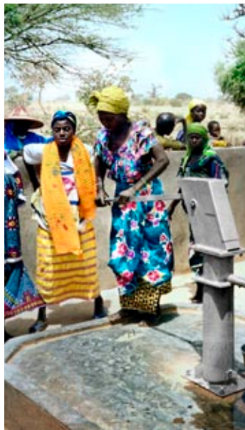
Проект доступного водоснабжения "Вода для ВСЕХ" компании Atlas Copco.

Сертификация на основе ISO 14001 – общепризнанного стандарта для систем экологического менеджмента – широко применяется в деловом секторе Швеции. В 2010 г. было сертифицировано более 3800 компаний. В ряде отраслей, например, в полиграфической промышленности, сертификация обеспечивает серьезные конкурентные преимущества. По статистическим данным Шведского института стандартов, Швеция является одним из мировых лидеров по числу экологически сертифицированных компаний в пропорции к населению.