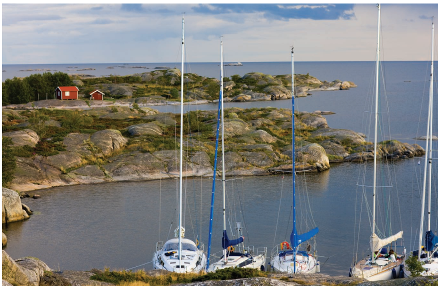
La Baltique dans le sud de la Suède.