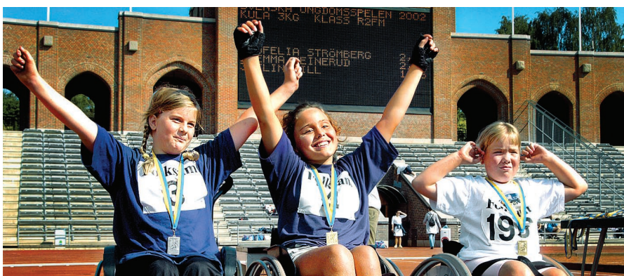
L'égalité d'accès, un facteur essentiel de la vie courante.