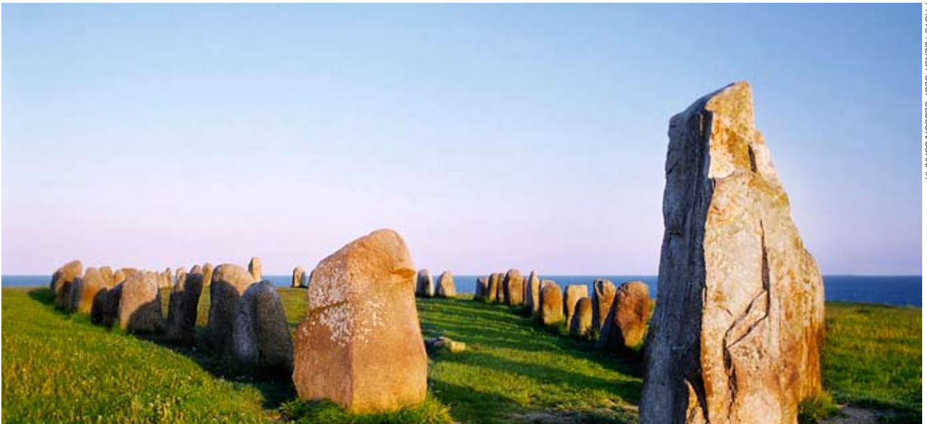
Les mégalithes d'Åle, à Österlen, sur la côte sud de la Suède. Le monument a été érigé vers 600 après J.-C.