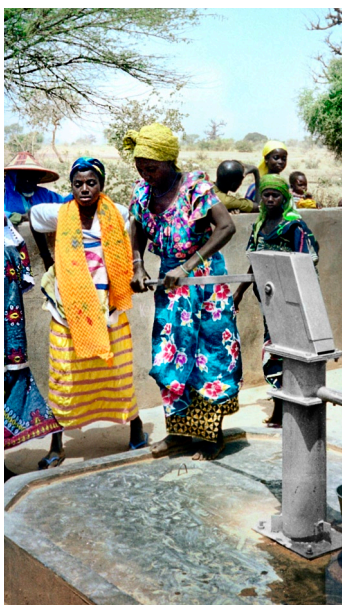
L'eau pour tous, un projet d'Atlas Copco.

La certification ISO 14001 pour les systèmes de gestion environnementale est largement utilisée par les entreprises suédoises – plus de 3 800 d'entre elles ont été certifiées en 2010. Dans certains secteurs, l'imprimerie par exemple, la certification assure un sérieux avantage concurrentiel. Selon les statistiques de l'institut de normalisation suédois, la Suède est un des pays qui compte le plus d'entreprises à certification environnementale par habitant dans le monde.