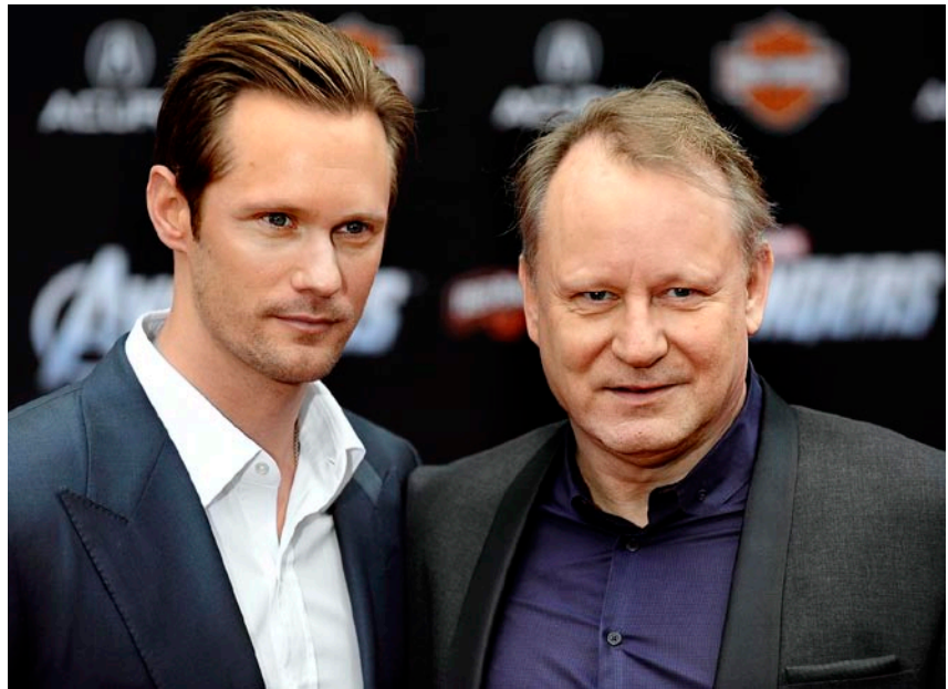
Alexander Skarsgård trat in die Fußspuren seines Vaters Stellan – wie auch seine beiden jüngeren Brüder

Alicia Vikander konnte eine Rolle in Joe Wrights „Anna Karenina“ (Anna Karenina, 2012) ergattern und wird auch im Horrorfilm „Der siebte Sohn“ (The Seventh Son, 2013) mit Julianne Moore und Jeff Bridges in den Hauptrollen zu sehen sein.