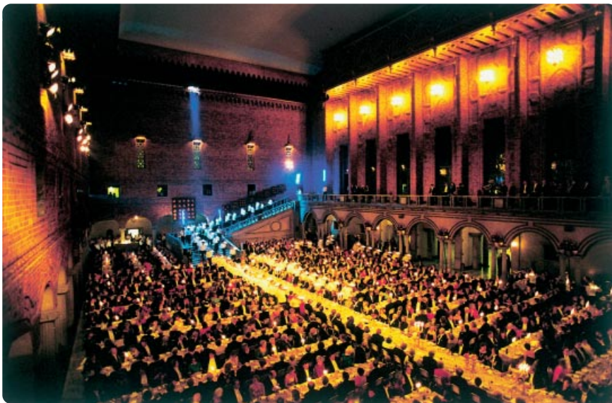
Tukholman kaupungintalon sisinässä salissa pidettävään arvostettuun Nobel-juhlaan osallistuu joka vuosi noin 1 300 vierasta.

Tämä Ruotsin instituutin julkaisema teksti on luettavissa myös osoitteessa www.sweden.se . Sitä ei saa kopioida, siirtää, esittää, julkaista eikä lähettää tai levittää millään tavalla ilman Ruotsin instituutin lupaa. Jos haluaa luvan tekstin käyttämiseen, tulee ottaa yhteys osoitteeseen webmaster@sweden.se . Kuvia ja piirroksia ei saa koskaan käyttää muissa yhteyksissä.