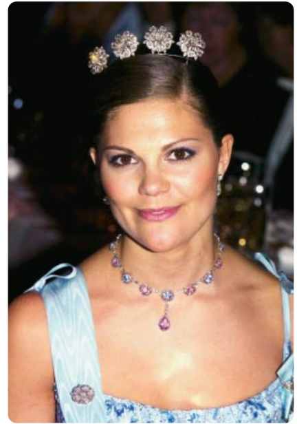
Kruununprinsessa Victoria Nobel-juhlassa Tukholmassa.

Palkinnonsaajien ei tarvitse itse ajatella kaikkia niitä monia yksityiskohtia, joita ilmaistaan. Heille varataan huoneet Kuningaskansallisen vastapäätä olevasta Grand Hotellista. Siellä on Nobel-vieraita varten erillinen vastaanottotiski ja jokaisella palkinnonsaajalle on käytössään oma Nobel-avustajansa Ruotsin Ulkoasiainministeriöstä.