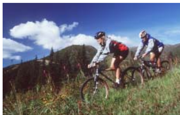
Året ei tunta ainuüksi suusaparadiisina. Suvel kogunevad mägratturid siia treenima ja võistlema.