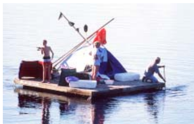
Retk endaehitatud parvel Klarälveni jõel Värmlandis. Hea õne korral võid kohtuda kopra või pödraga ning saada osa paksude laante maagiast.