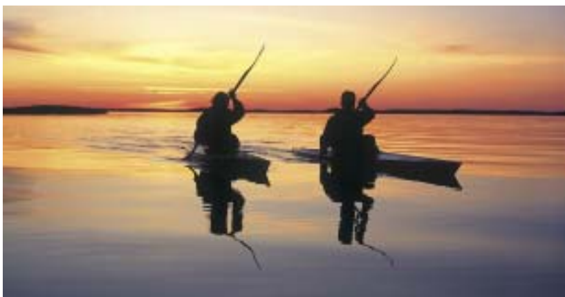
Süstasõit järvel või jõel jätab unustamatu mälestuse. Paki kaasa telk ja magamiskott ning naudi looduse rahu.