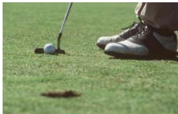
Sind ootavad 418 hästihooldatud golfirada. Skänet oma 60 golfirajaga peetakse Rootsi golfiparadiisiks. Enamik radadest on avatud ka külalistele.