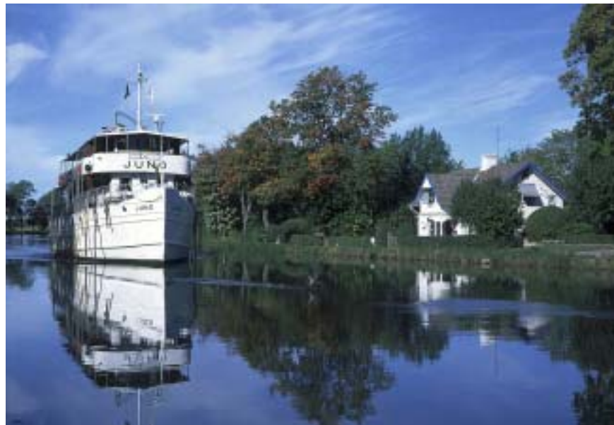
Söderköpingust saab alguse 58 lüüsi Gøta kanal, mis läbib risti kogu Rootsi ja suubub Gøteborgis.