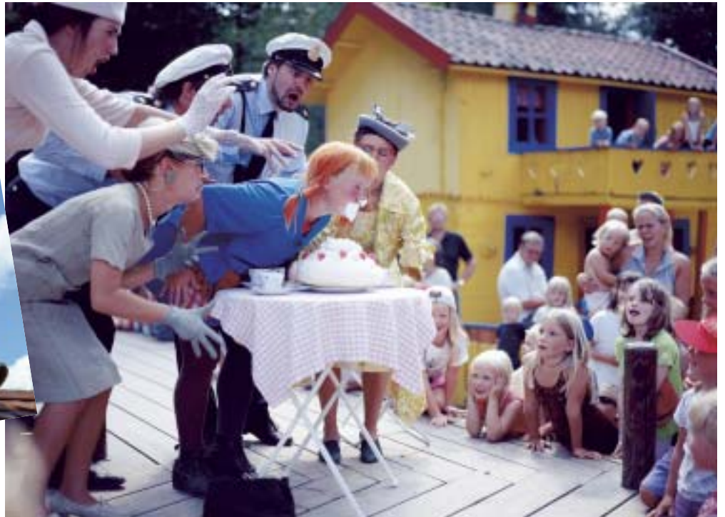
Astrid Lindgreni maailmas Vimmerbys võid külastada Pipi Pikksukka Segasummasuvilas või maailma parimat Karlssonit katuselt, kelle käsutuses on suvel lausa omaette maja.