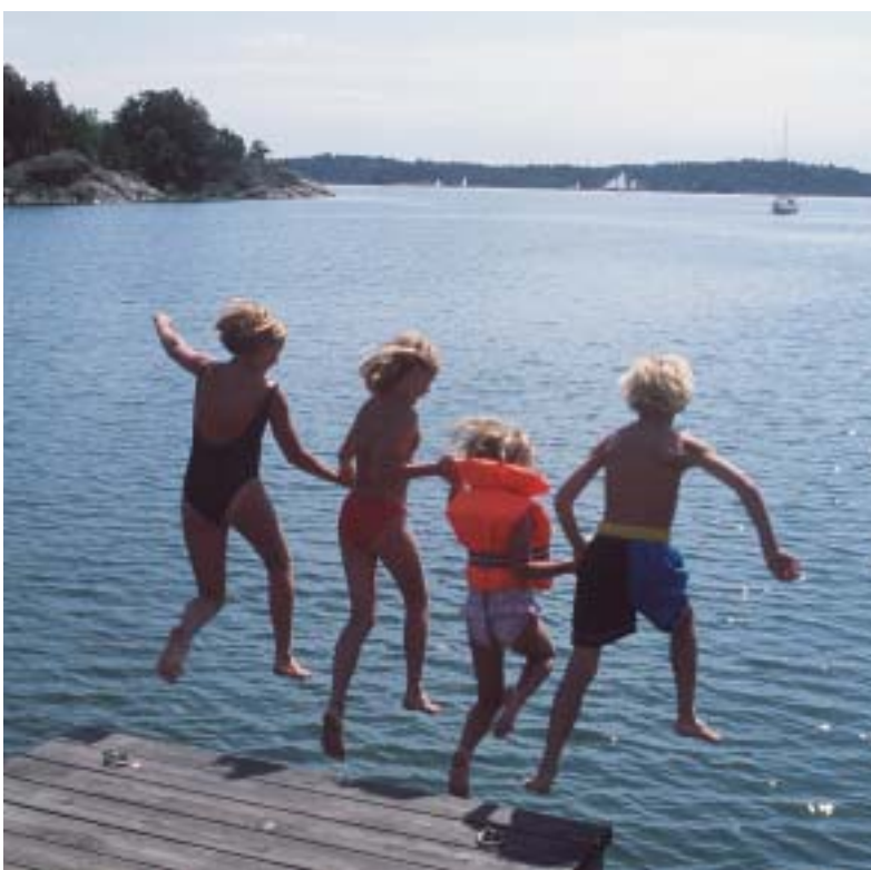
Vesi Rootsi tuhandetes järvedes ja mererandades on puhas ja värskendav.

Võid minna Lapimaale ja vallutada Rootsi kõrgeima mäe Kebnekaise, osaleda Sörmlandsledeni elamusrikastel retkedel ja veeta suusapuhkuse Sälenis või Åres. Unustamatu elamuse saad ka purjetades Stockholmi saarestikus, golfirajal, kanuu- või kalastusretkel. Rootsis leidub midagi igaühe jaoks – nii vaikust ja rahu kui ka kiirust ja põnevust.