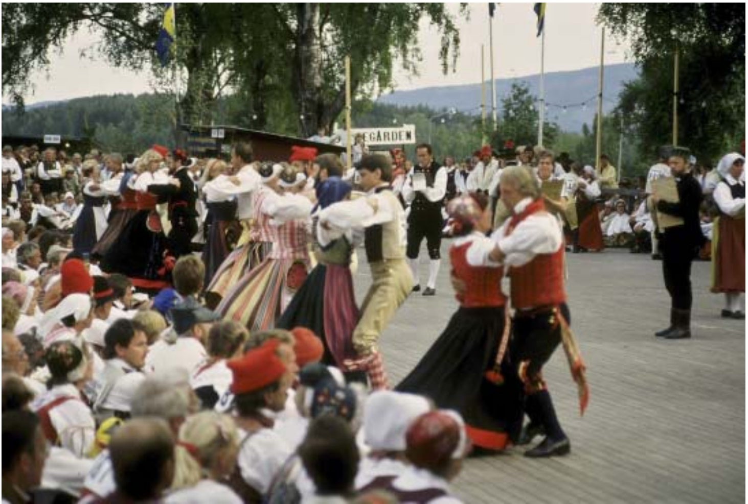
Rahvatantsul on Rootsis pikaajalised traditsioonid. Hambotantsu mitteametlikel maailmameistrivõistlustel, Hälsingehambo festivalil, osaleb 1500 tantsijat. Võistlus toimub neljas Hälsinglandi linnas ning kestab mitu päeva.