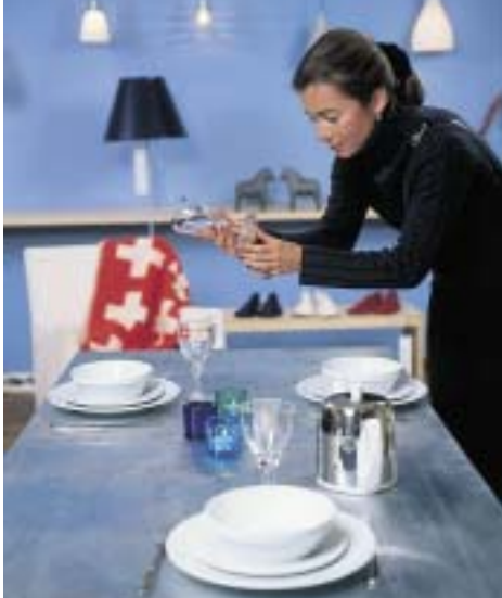
Kesklinna kauplustest võid leida tooteid, mis esindavad kõrgetasemelist rootsi disaini.