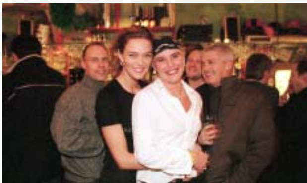
Võid nautida suurepärast õhtusööki ühes paljudest restoranidest või ekskluusivetest körtsidest ning lõpetada öhtu mõnes populaarses klubis.