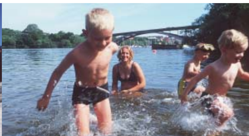
Ka Stockholmi ümbritsev vesi aitab mõnusalt aega veeta. Talvel kasutavad tema jääpinda uisutajad, suvist vett naudivad aga nii purjetajad kui ka suplejad.