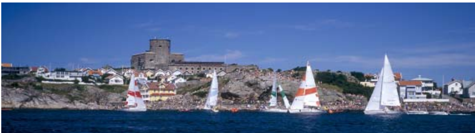
Marstrandis koguneb igal suvel maailma purjetajate eliit, et osaleda maailma karika etapil match race'is – mees mehe vastu purjetamises.