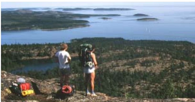
Põhja-Rootsi pakub arvukaid võimalusi matkamiseks. Skulebergeti mäelt Ångermanlandis avaneb muinasjutuliselt kaunis vaade Botnia lahele.