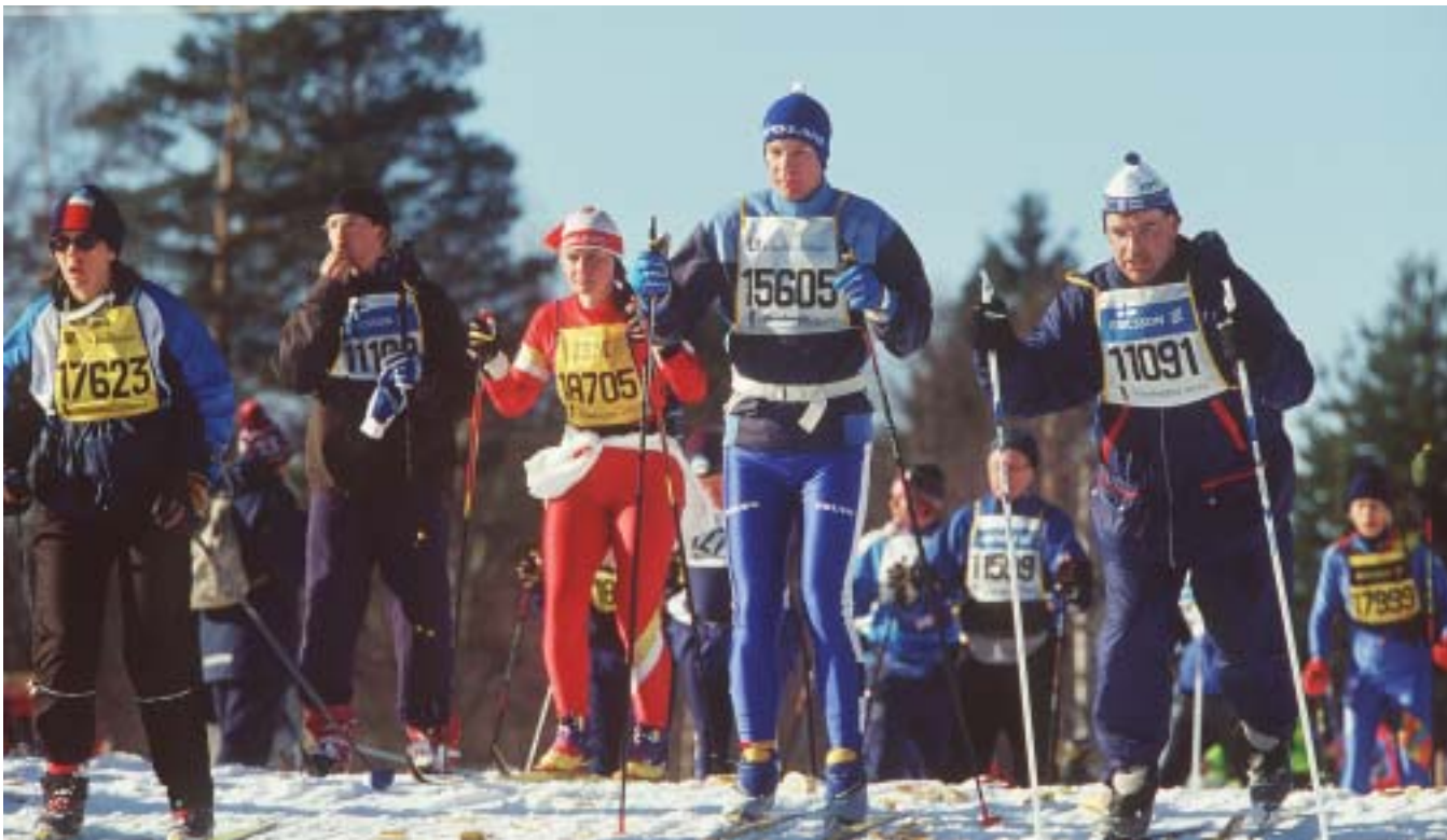
Märtsi esimesel pühapäeval toimub Vasaloppet, maailma pikim suusamaraton. Suuskadel läbitakse 90 km Sälenist Morasse. Vasaloppetiga lõpeb spordiküllane nädal, mille jooksul on peetud mitu populaarset suusavõistlust nagu Öppet Spår, Tjejvasan ja Barnens Vasalopp. 2002. aastal startis Vasaloppeti suusanädalal üle 41000 suusataja.