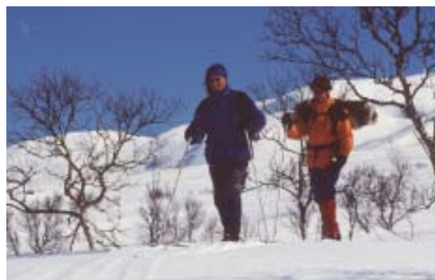
Suusaretkelised teel puhkemajja Härjedalsfjälles.