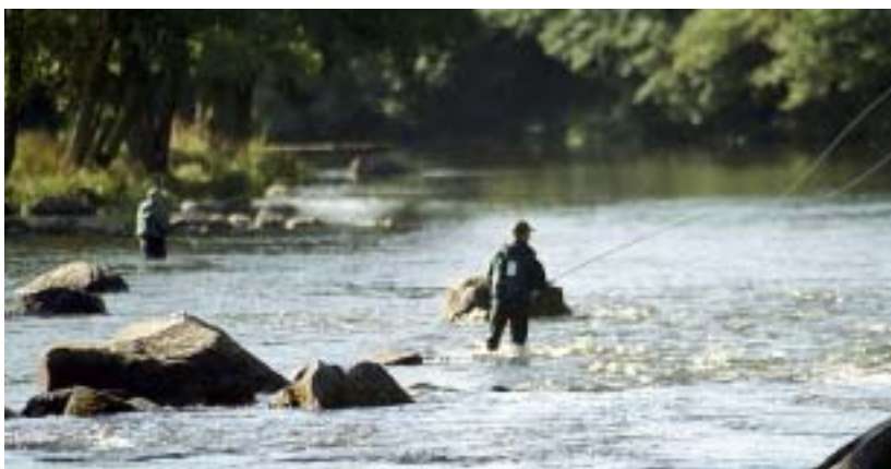
Blekinge Mörrumi jõe kalasaak on maailmakuulus. Osav kalamees võib uhkustada päris purakate lõhede ja mereforellidega.