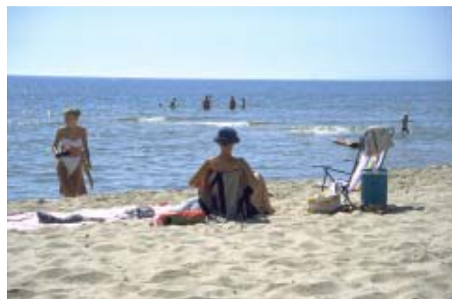
Päev Åhusi rannal Skånes.

Reisist piki Ölandi rannikut jäävad eelkõige meelde tuuleveskite siluetid. Tuuleveskeid ehitati Ölandile juba keskajal. Rootslased armastavad oma puhkust Ölandil veeta. Ka kuningliku perekonna suveresidents Solliden asub päikese ja tuulte saarel. Öland, mida ühendab mandriga ainulaadne sild, on tuntud tänu oma suurepärasele randadele, rikkale kultuurielule, lõbustusparkidele ja golfiradadele.