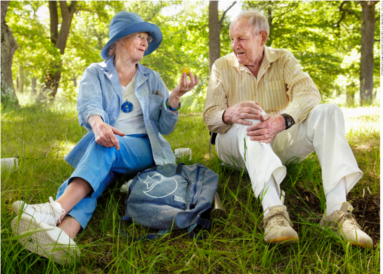
La atención a los mayores contribuye a que lleven una vida normal e independiente.