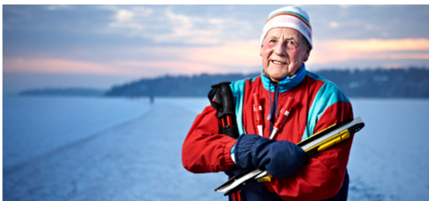
Muchas personas mayores llevan una vida activa.