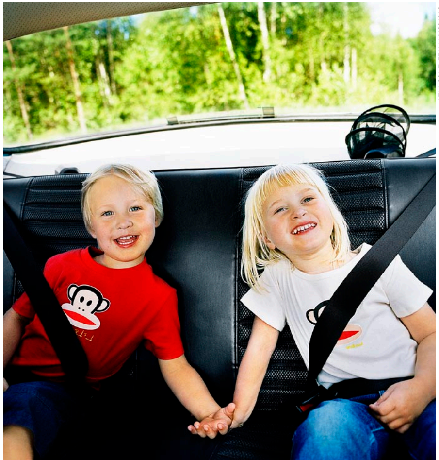
Se calcula que el cinturón de seguridad de tres puntos, creado por Nils Bohlin, ha salvado una vida cada seis minutos desde que empezó a usarse, en 1959. Se reconoce como una de las más importantes innovaciones de seguridad de los automóviles en todos los tiempos.

1 SEK (corona sueca) = 0,11 EUR ó 0,14 USD (diciembre 2011)