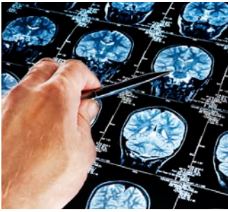
BioChromix se ocupa de diagnosis temprana de la enfermedad de Alzheimer.