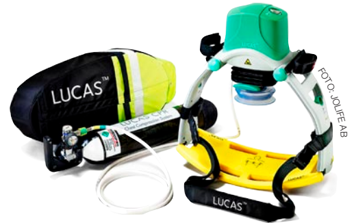
Lucas, el sistema de compresión cardíaca, es un aparato médico sueco.

La microelectrónica también cuenta con un mercado en expansión. Suecia está a la vanguardia en investigación de componentes a base de silicona, electrónica de alta velocidad, electrónica orgánica, fotónica y diseño de sistemas. ■