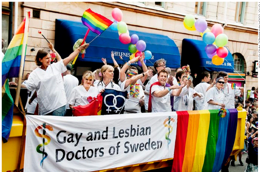
Se protegen los derechos de las minorías. Las leyes y normas suecas no pueden conducir a que nadie se vea desfavorecido debido a su pertenencia a una minoría.

Por medio de los servicios públicos de televisión (SVT) y radiodifusión (SR), todos los ciudadanos tienen acceso a una gama variada de programas sin publicidad. Las operaciones se llevan a cabo de forma independiente del Estado sueco y de otros intereses económicos y políticos. Además, hay varios canales comerciales.